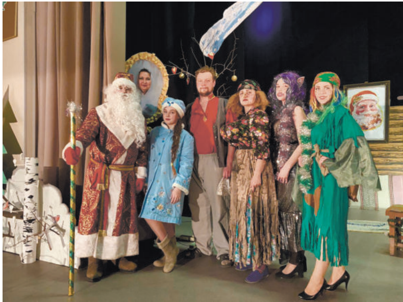
Театральный коллектив «Мельпомена» Фоминского РДК.