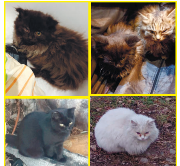
Фотопанорама в телефоне зооволонтера переполнена фотографиями кошек, которые ищут свой дом и любящих хозяев.

«Многие знакомые лично ко мне обращаются с желанием взять питомца домой. Мы пристраиваем в неделю до четырех кошек. Пока одному ищем дом, пять животных выбрасывают. Сейчас среди бездомных пушистиков можно встретить