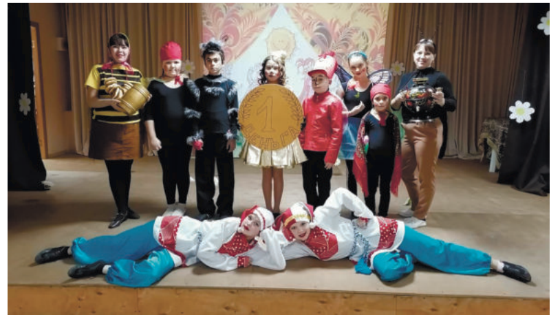
Театральная студия «Овация» Зайковского СДК.

Поздравьте родных и близких в газете «Родники ирбитские» Поздравление в стихах с фотографией: на цветной 12 стр. – 500 руб., на ч/б – 250 руб. Поздравление с краткой биографией именинника и фотографией: на 12 стр. – от 1000 руб., ч/б – от 600 руб. Звоните: 8(34355)2-05-60.