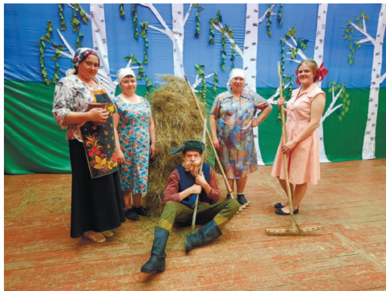
Театральное любительское объединение «Позитив» Стриганского СДК.

рошина» Ницинского СДК за пьесу «Свадьба в Масленовке, или Новогодние ромашки». Увлеченные театральным мастерством подростки и взрослые коллектив